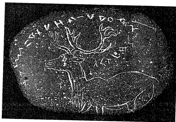
5. Sur le même objet, deux périodes de la préhistoire officielle se trouvent réunies (le magdalénien et l'avènement de l'écriture) : l'assemblage du galet, du renne et de l'inscription matérialise la thèse de Morlet.