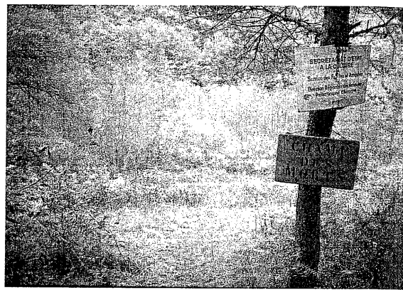
2. Le panneau marquant l'homologation du site par le Ministère de la Culture est planté sur ce qui reste du terrain de fouilles aujourd'hui envahi par les herbes, les ronces et les fougères et sur lequel on discerne à peine quelques traces d'excavations.

trines ? Une affaire comme celle de Glozel ne se limite pas à des entrecroisements d'argumentaires relatifs à des doctrines archéologiques concurrentes. Les protagonistes multiplient les épreuves d'identification des objets : ces derniers doivent supporter les arguments ou, si l'on aime les inversions, les arguments doivent passer dans les objets pour tenir. Mais comment les fait-on passer dans les objets, là est toute la question. Ces problèmes ont-ils un lien avec le fait que Glozel passe de l'état de controverse archéologique à celui de dossier concernant les parasciences ? Peut-on décrire le rôle des contraintes d'authentification dans cette transformation ?