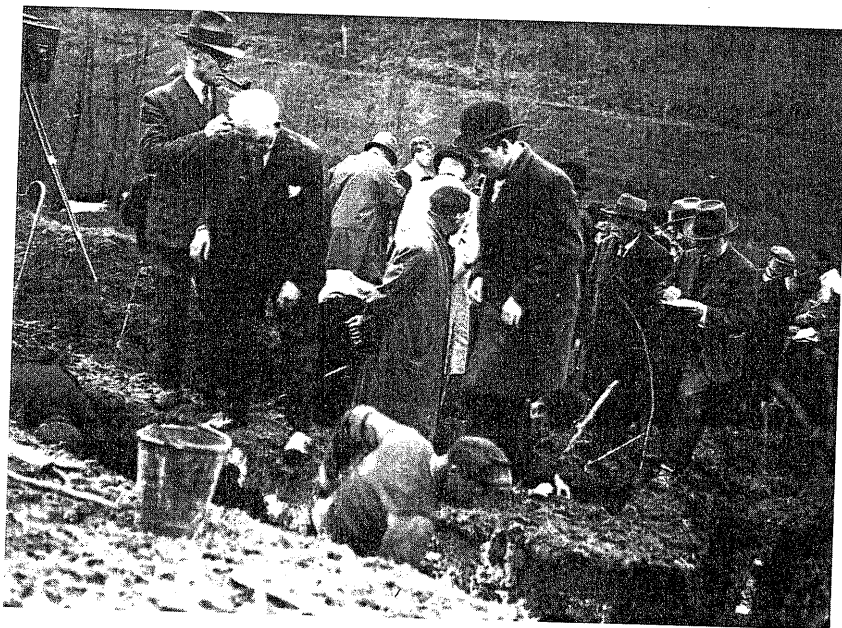
8. Le Champ de fouilles reçu entre 1925 et 1928, des centaines de visiteurs, savants, journalistes, hommes politiques, amateurs et curieux.

L'expertise collective ne s'arrête pas cette fois-ci à un contrôle des fouilles effectué en personne comme dans les Journées mémorables . Il faut contrer l'adver-